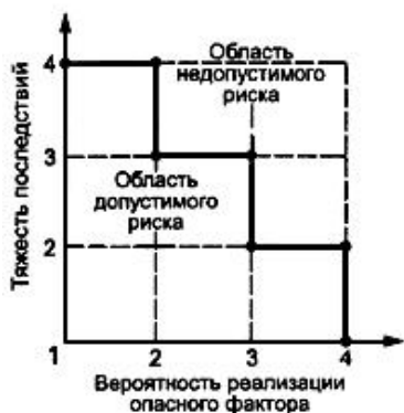
Рисунок Б.1 - Диаграмма анализа рисков