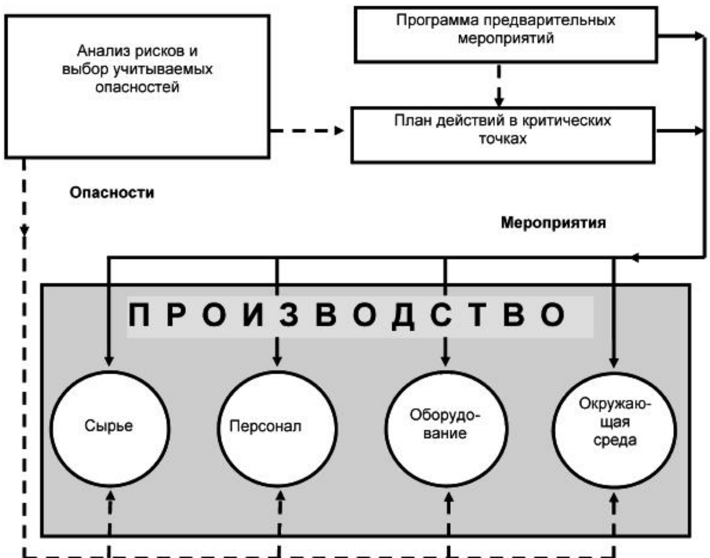
Рисунок 1 - Анализ опасностей и их устранение в процессе производства

2 уровень - это действия в критических контрольных точках, которые с учетом мероприятий 1-го уровня, должны обеспечить устранение или снижение до допустимого уровня всех учитываемых опасных факторов. Данный подход иллюстрируется схемой, представленной на рисунке 1.